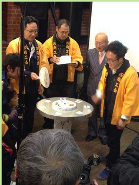
2014年2月に開催された三遠南信出世場所の様子

また、コマ大戦の開催や運営内容にご興味がある 事業者様の視察利用も歓迎いたします。